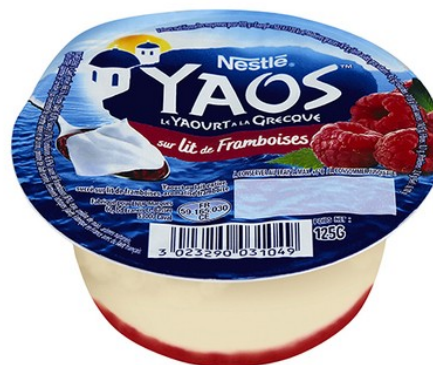
Photo non contractuelle, suggestion de présentation