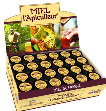
Photo non contractuelle, suggestion de présentation