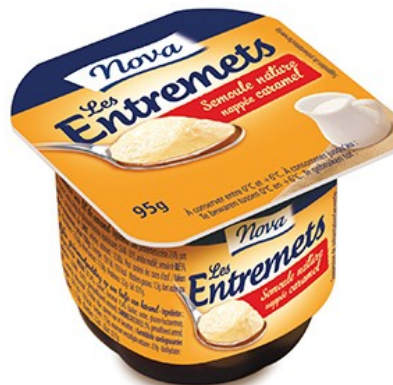
Photo non contractuelle, suggestion de présentation