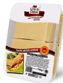
Photo non contractuelle, suggestion de présentation