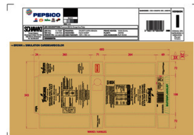
Photo non contractuelle, suggestion de présentation