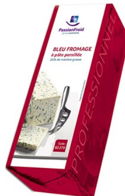
Photo non contractuelle, suggestion de présentation