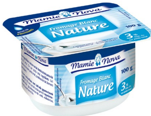
Photo non contractuelle, suggestion de présentation