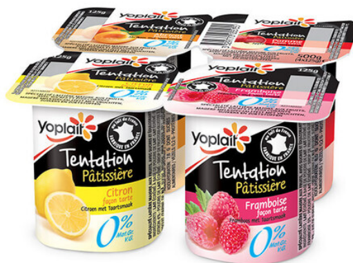
Photo non contractuelle, suggestion de présentation