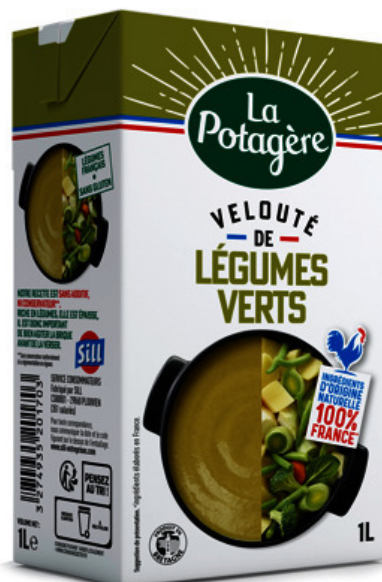
Photo non contractuelle, suggestion de présentation