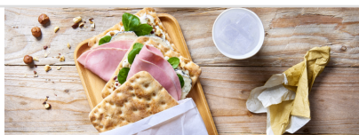
Sandwich pain suédois jambon au chèvre

Retrouvez tous les éléments dont vous avez besoin pour réaliser de belles recettes proposées par de grand pâtissier. Composition de la recette, astuces, montage et beaucoup d'autres informations utiles.