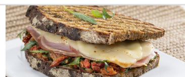
Grand croque à la romaine