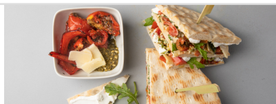
Club sandwich chèvre et légumes marinés