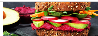
Sandwich Houmous Betterave crudités