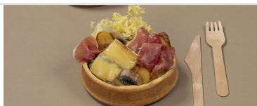
Croq' Bowl Savoyard