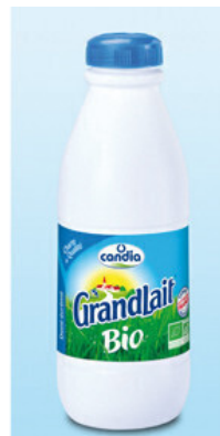
Photo non contractuelle, suggestion de présentation